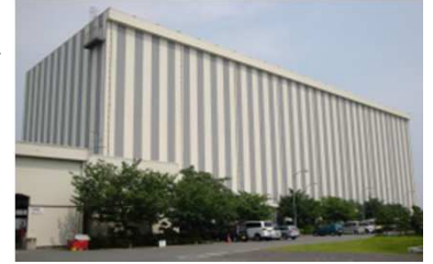
高さ30メートルの立体自動倉庫